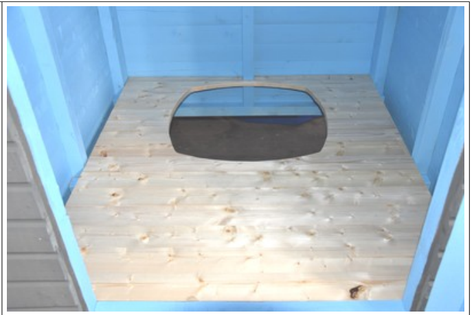
Lattialevyn kiinnitys 80 mm ruuveilla tukipuihin. Ennen Biolanin asennusta poista laitteen tyhjennysluukun korvakkeet. Biolanin asennuksen jälkeen tiivistä kattoläpivienti liima/tiivistemassalla.