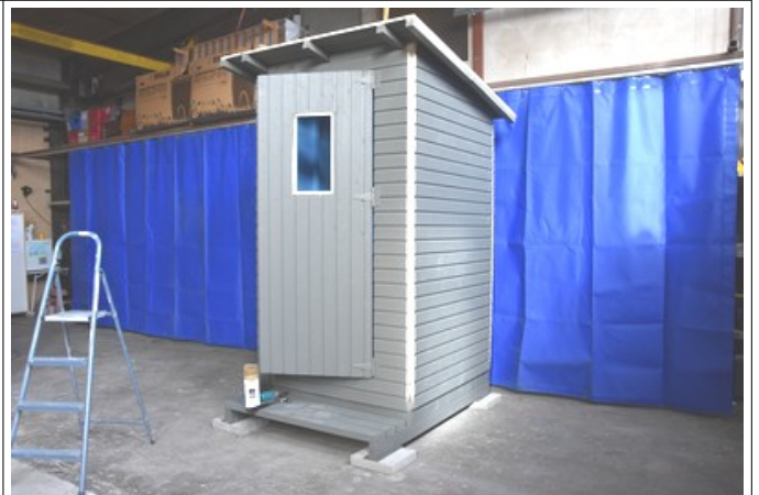
Alempi lappeen puolikas 10 cm takaa ulos. Kiinnitys 80 mm ruuveilla sivuseinien yläjuoksuihin. Kiinnitä huopatai muu kate valmistajan ohjeiden mukaan.