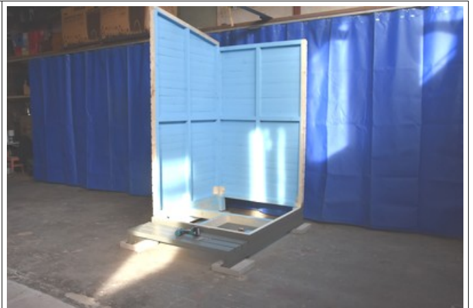
Sivuseinä ja takaseinä kiinni toisiinsa ja sokkeliin 80 mm ruuveilla (5 ruuvia / nurkka).