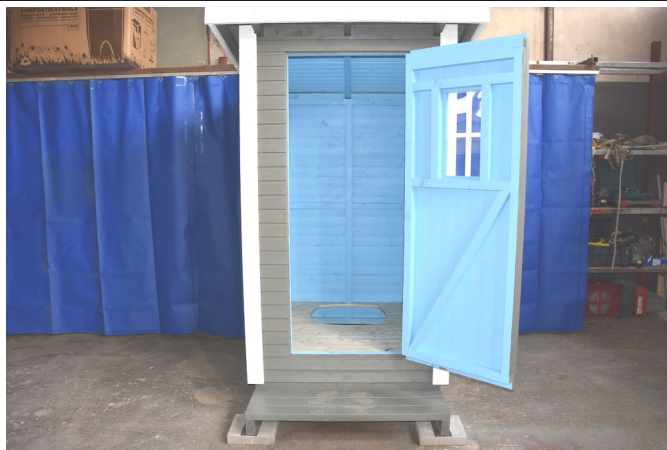
Listojen asennus 45 mm ruuveilla. Poraalkureikä etteivät laudat halkea.