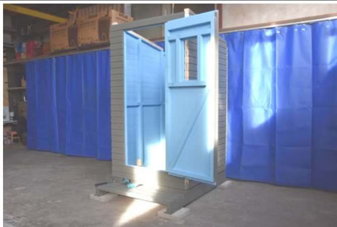
Loput seinät ja ovi. Saranoiden kiinnitys 45 mm ruuveilla.